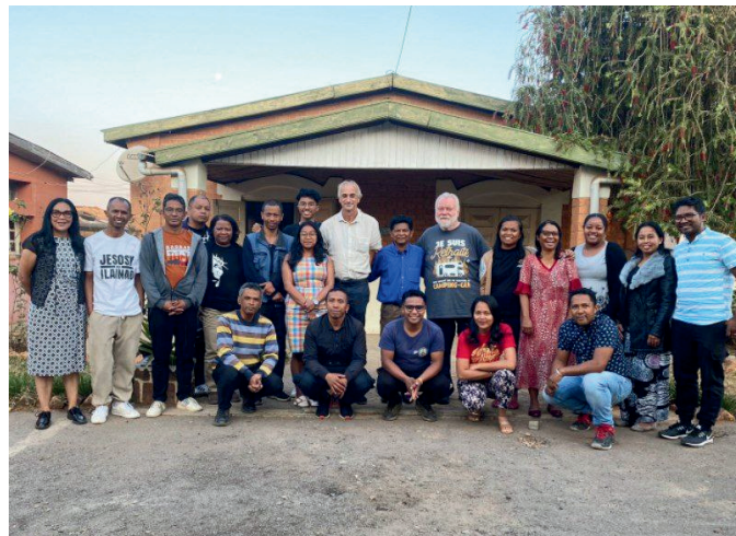
Avec une partie de l'équipe de la LLB de Madagascar

Nous sommes très heureux de collaborer avec la Ligue pour la Lecture de la Bible de Madagascar, qui a réalisé la traduction des 170 histoires pour enfants en malgache, et qui est très active et même proactive ! Pensons à eux dans la prière, alors que certains équipiers sont éprouvés dans bien des domaines.