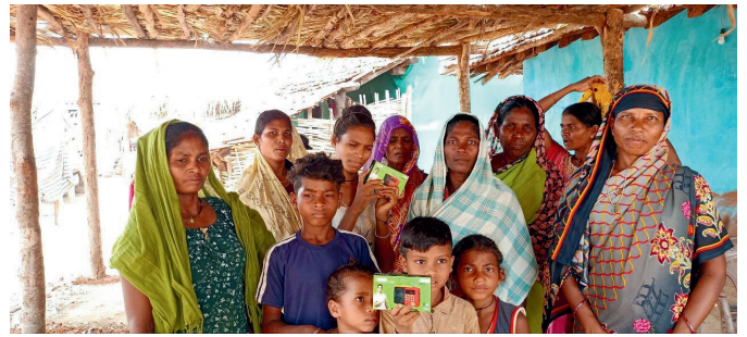
Distribution de lecteurs Audio Vie au Penjab, une région non atteinte au nord-ouest de l'Inde où la religion majoritaire est la religion sikh.