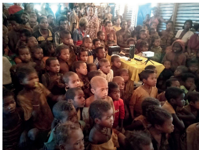
Projection d'un film d'évangélisation dans la langue des Mikéas